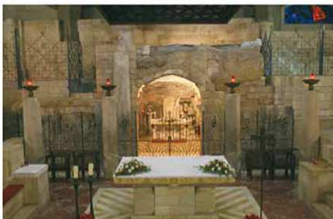
Nazaret. Casa de la Virgen.