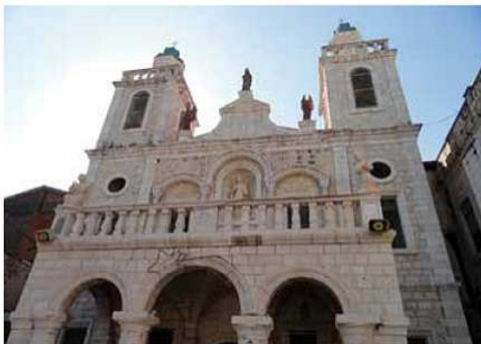
Caná de Galilea