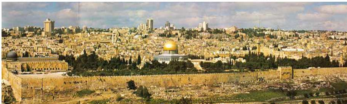
Vista de Jerusalén.